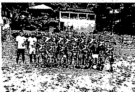
EQUIPE DO REAL MONACO

Três jogos movimentam a competição neste final de semana