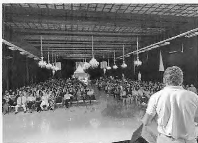
► CORRETORES DURANTE O LANÇAMENTO DE MAIS UM EMPREENDIMENTO DA MRV

Em São Luís, o desempenho da MRV acompanha esse movimento de expansão. Há 14 anos presente no Maranhão, a construtora reforça sua relevância na capital, onde, a cada 160 ludoenses já mora em um imóvel MRV. Nesse período, a empresa realizou mais de R$ 1 bilhão em Valor Geral de Vendas (GVV), investiu R$ 15 milhões em urbanização, gerou mais de 20 mil empregos e