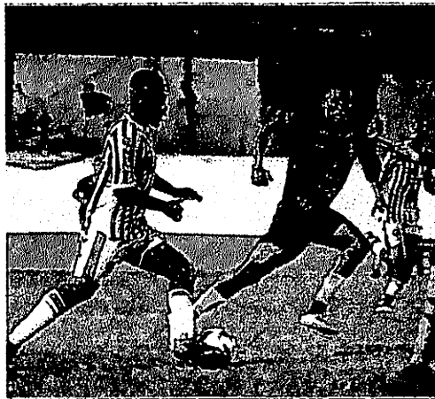
▷ O TIME DO PINHEIRO (DE PRETO) DOMINA O JOGO O TEMPO TODO E VENCEU COM QUALIDADE

A vítima da vez foi o time do Maranhão Atlético. O jogo foi realizado no estádio Costa Rodrigues, e o "Búfalo da Baixada" venceu por 2 a 0